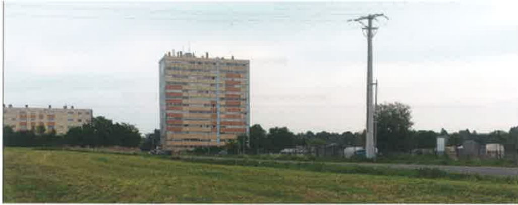
L'environnement bâti et les jardins ouvriers