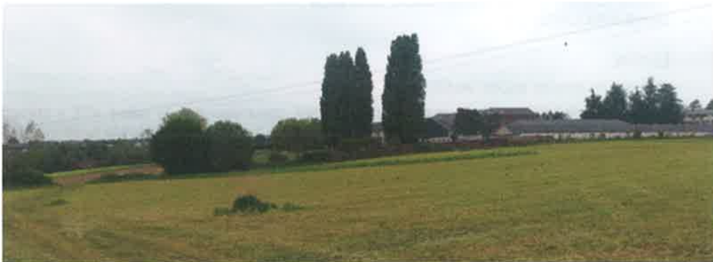
Le terrain avec en arrière-plan la résidence de personnes âgées