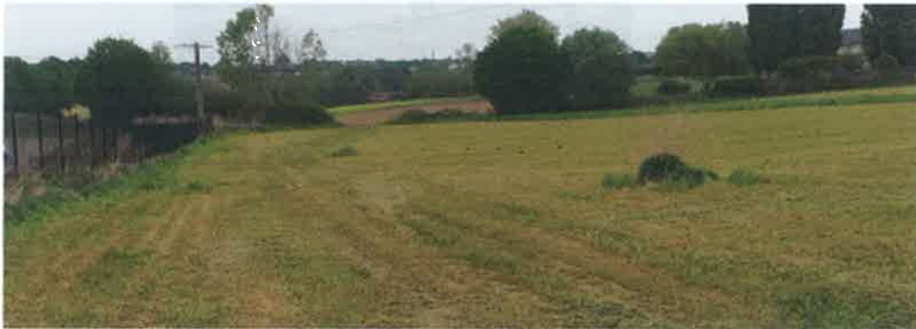
L'emplacement de la voirie d'accès et à gauche l'établissement industriel.